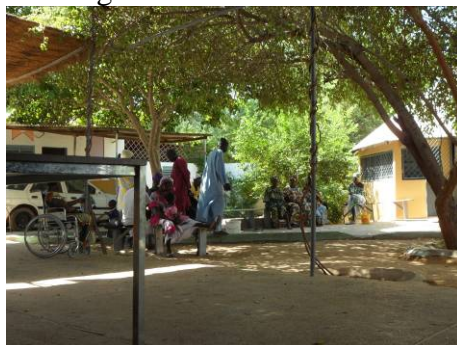
La cour du CRF