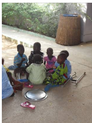
Repas en attendant la consultation