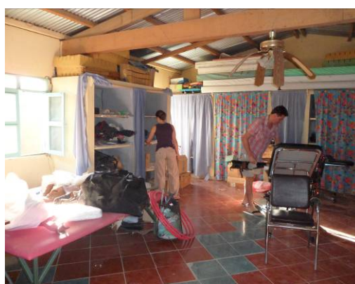
rangements en salle kiné